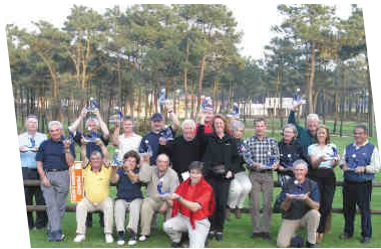
Premiados da 11ª Edição